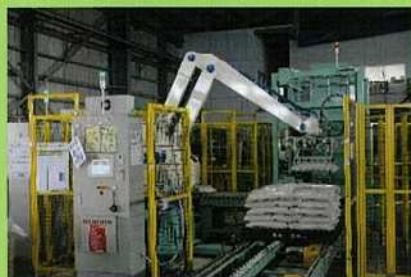
6 パレット積付(ロボットパレタイザー)