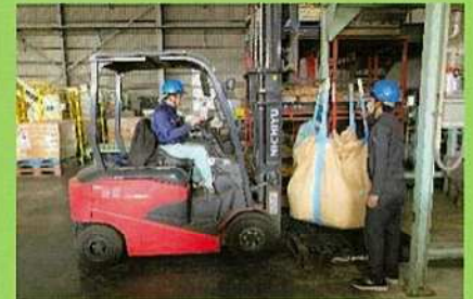
5 包装工程(フレコン袋)