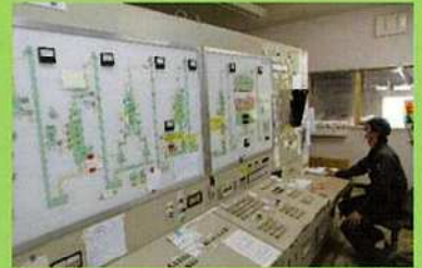
製造工程を集中管理(制御室)