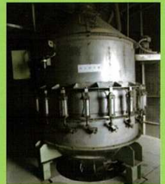
3 肥料の配合工程(配合機)